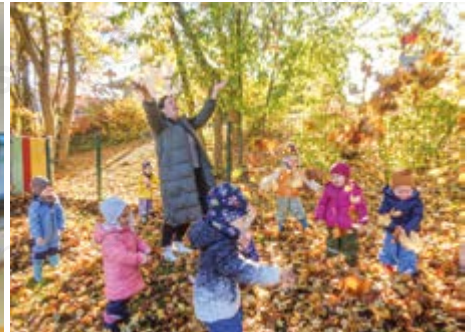
Blätterregen im Garten