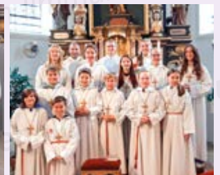
Alle anwesenden Ministrantinnen und Ministranten