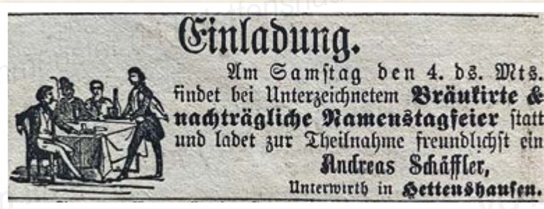
Frühe Anzeige aus dem Jahr 1880

Obwohl Hettenshausen bis in das 19. Jahrhundert hinein keine Dorfwirtschaft besaß, finden sich vereinzelt Hinweise auf Veranstaltungen, die es im Ort gab. So reisten Theatergesellschaften aus München, häufig auch aus weiter entfernten Gegenden, durch das Land und gastierten an verschiedenen Orten im Freien. In Hettenshausen machte im Jahr 1798 ein derartiges Ensemble Zwischenstation und spielte an einem nicht näher bezeichneten Platz kleine Theaterstücke.