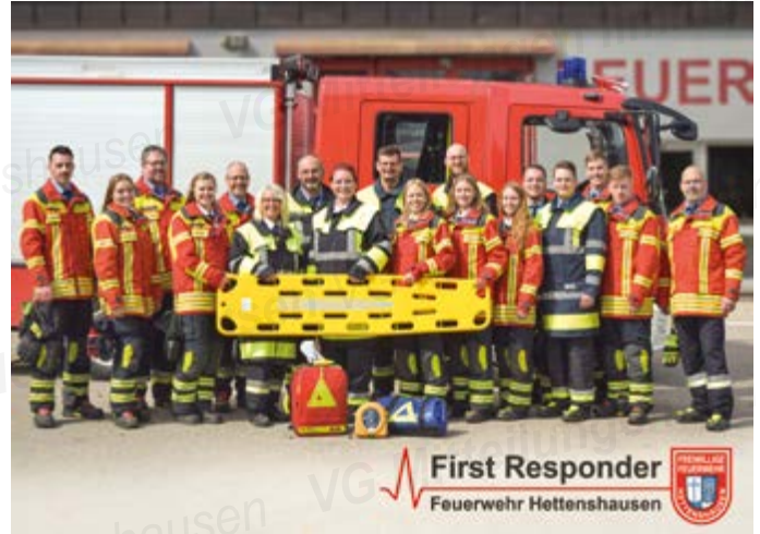
Die Mannschaft des First Responders der Feuerwehr Hettenshausen

Am 01.12.2023 startet eine 6-monatige Testphase. Die sechs Monate sollen zeigen, ob dies zusätzlich zum regulären Feuerwehrdienst personell und zeitlich zu stemmen ist.