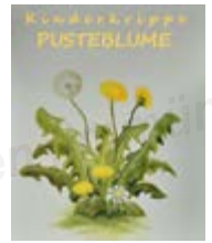
Bilder und Text: Kinderkrippe Pusteblume

einem bunten Blätterregen im Garten für die Kinder und vielen, ausgedehnten Spaziergängen.