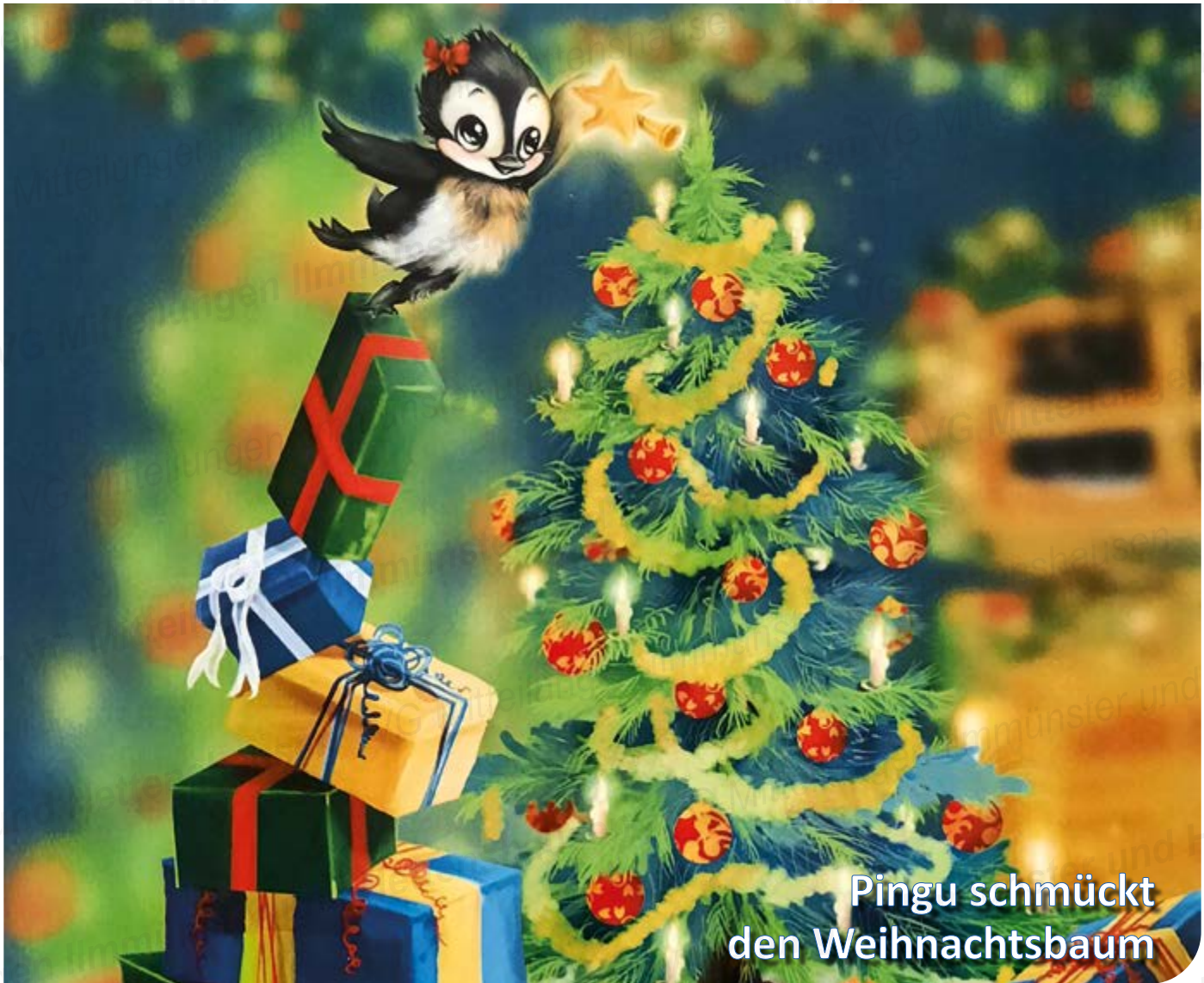
Pingu schmückt den Weihnachtsbaum

MITTEILUNGSBLATT FÜR DIE VERWALTUNGSGEMEINSCHAFT DER GEMEINDEN ILMMÜNSTER UND HETTENSHAUSEN