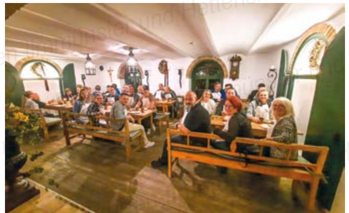
Vereinsausflug der Aktiven Wehr mit Jugendgruppe zum Ritteressen nach Unterpindhart

Auf einen besonderen Vereinsausflug durfte sich unsere Aktive Wehr samt Jugendgruppe am 27. Oktober 2023 freuen. Gemeinsam ging es für uns nach Unterpindhart zur Gaststätte Rockermeier, wo wir an einem Ritteressen teilnahmen. Dies ist ein 8 Gänge-Menü, bei dem jedem nur ein Brotzeitbrett und ein Messer zur Verfügung stehen. Durch den Abend führte uns ein mittelalterlich gekleideter Mann, der uns mit musikalischen Einlagen einen besonders lustigen Abend bescherte.