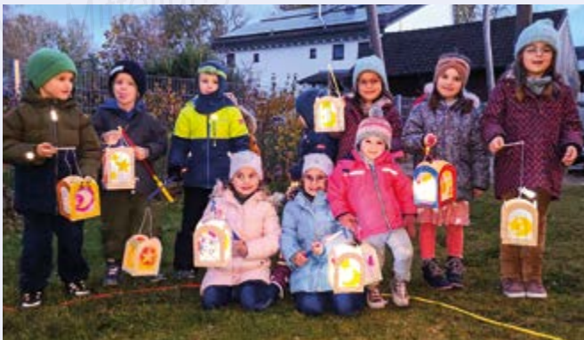
Fröhliche Ilmzwergerl bei der St. Martinsfeier

Am 10.11.2023 war es wieder soweit. Die Ilmzwergerl-Kinder haben sich ganz besonders auf St. Martin gefreut. Mit den