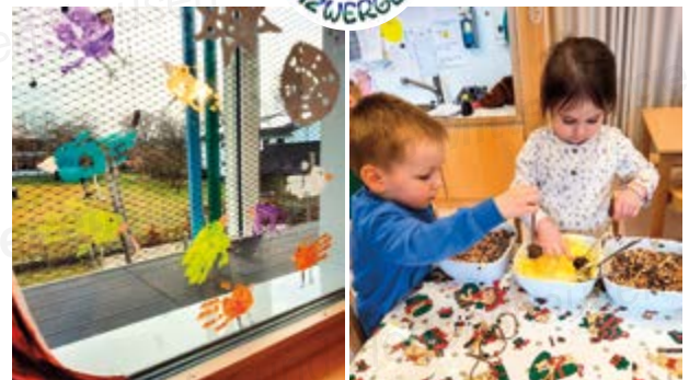
Bilder und Text: Kinderhaus Ilmzwergerl

Im Januar und Februar nehmen wir uns Zeit, die Natur im Winter genau zu beobachten. Dabei entdecken wir in unserem Garten immer wieder Vögel, die auf der Suche nach Futter durch unsere Wiese hüpfen. Schon war die Neugierde der Kinder geweckt. Welche heimischen Vogelarten können wir bei uns im Kinderhaus beobachten? Wo schlafen die Vögel im Winter? Was fressen die Vögel im Winter? Wir suchen gemeinsam Antworten auf die vielen Fragen, dekorieren unsere Fenster mit bunten Vögeln und stellen Vogelfutter her. Vielleicht locken wir so noch mehr Vögel an, die wir dann aus der Nähe noch besser bewundern und beobachten können.