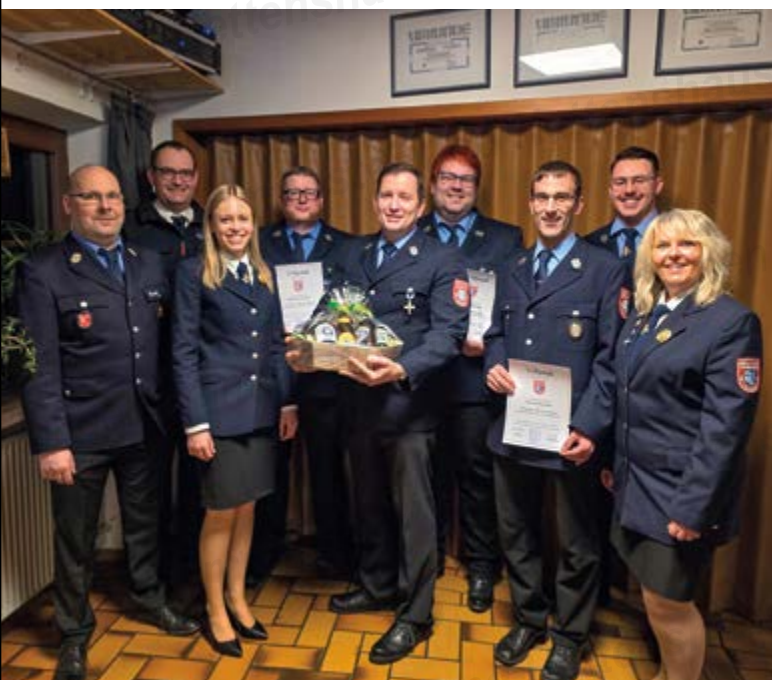
Unsere Vorstände, Kommandanten und unser Kreisbrandmeister zusammen mit den Geehrten