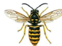
Sächsische Wespe ( Dolichovespula saxonica )