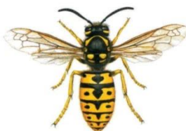
Deutsche Wespe ( Paravespula germanica )