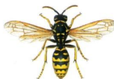
Gallische Feldwespe ( Polistes dominulus )