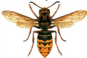
Hornisse ( Vespa crabro )