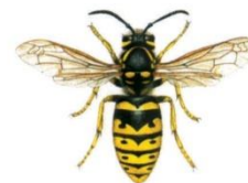
Gemeine Wespe ( Paravespula vulgaris )