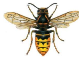
Mittlere Wespe ( Dolichovespula media )